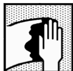
Dynacoat Uni Degreaser